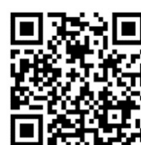
メダルオブジェ制作紹介